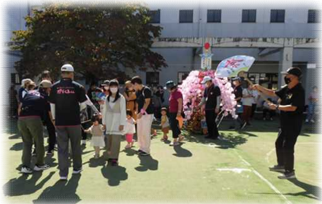
おまつりわっしょい♪笠ぼこの引きまわし