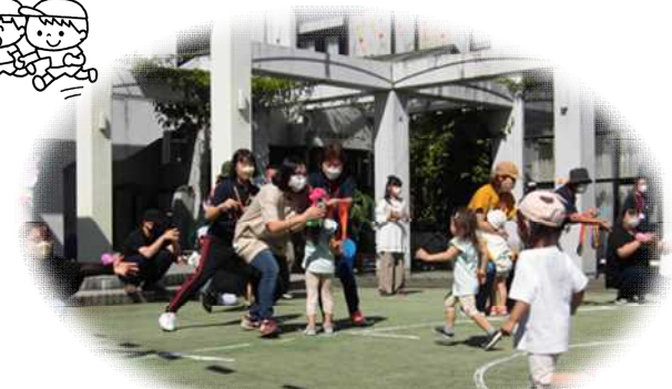
おかあさんのところまでよーいドン!