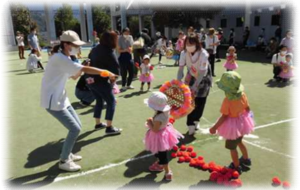
赤組・白組に分かれての玉入れ

今年もコロナ禍ではありましたが、基本的な感染対策のもと、晴天に恵まれての開催となりました。